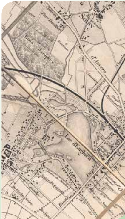
Carte du territoire en 1865

Au début du XX e siècle, les communes de la Vallée de Montmorency étaient des villages ou de petites villes (voir carte en 1865). Mais après un demi-siècle d'industrialisation et d'urbanisation, la pollution de la Seine et de ses affluents devient alarmante. Les champs d'épandage des eaux usées, dont celui de Pierrelaye-Méry, sont saturés.