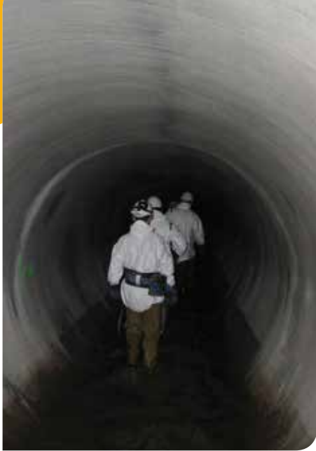
A l'intérieur d'un collecteur